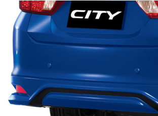
SENSORES DE REVERSA $8,155 M.N.