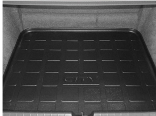
BANDEJA DE CARGA $1,029 M.N.