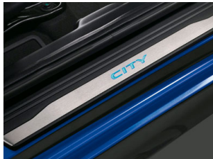
ADORNO PARA PISO DE PUERTA CON LUZ $3,803 M.N.