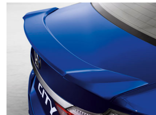
ALERON TRASERO $5,547 M.N.

Enganche desde el 10% y plazos de hasta 72 meses de financiamiento*