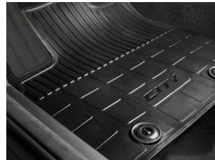
TAPETES TODA TEMPORADA $1,370 M.N.