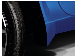
GUARDÁFANGOS $1,519 M.N.